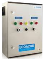
LLENADO DE DEPÓSITOS