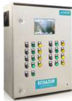
PLANTAS DE TRATAMIENTO DE AGUAS