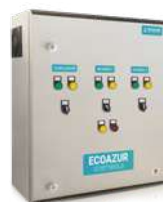
SISTEMAS DE JACUZZI