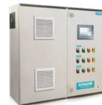
SISTEMAS DE PRESIÓN CONSTANTE