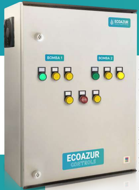
*Las imágenes de los tableros son representativas, el producto final puede diferir de la imagen representada en este folleto.

Cada tablero ofrece la función de alternar y simultanear las bombas para maximizar el tiempo de vida en los equipos por medio de un controlador lógico programable (PLC) de última tecnología como lo es SIEMENS .